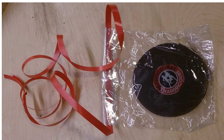
La médaille en chocolat !...