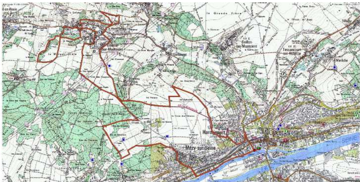
Parcours du Choco Trail - 24 km