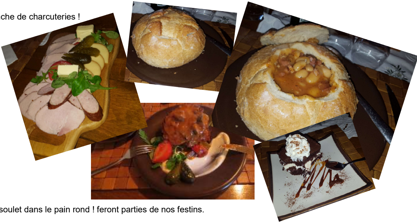
Planche de charcuteries !

Cassoulet dans le pain rond ! feront parties de nos festins.